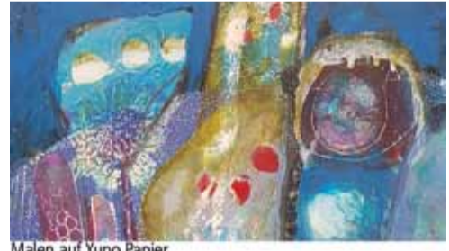
Malen auf Yupo Papier