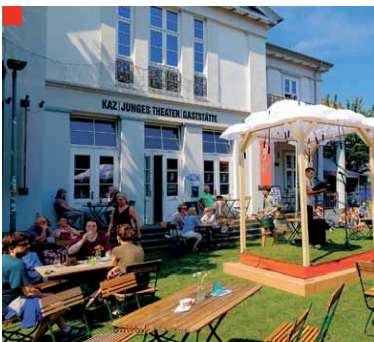
„Otfrieds Garten“, ein Projekt in 2018. Das Bild zeigt unser Quartier Otfried-Müller-Haus vor dem Umzug